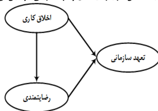
شکل ۱. مدل مفهومی تحقیق؛ ارتباط بین اخلاق کاری، رضایتمندی و تعهد سازمانی داوطلبان

از آنجا که نیروهای داوطلب از مهم‌ترین منابع انسانی در برگزاری رویدادهای ورزشی محسوب می‌شوند و با توجه به این که در کشور ما نیز در سال‌های اخیر استفاده از داوطلبان در برگزاری اغلب رویدادهای ورزشی داخلی، ملی و بین‌المللی رشد چشم‌گیری داشته است، لزوم انجام تحقیقات و مطالعات بیشتر در زمینه مسائل مربوط به داوطلبان مانند اخلاق کاری، رضایتمندی و تعهد سازمانی این افراد احساس می‌شود. بنابراین، هدف از این مطالعه، بررسی ارتباط اخلاق کار با رضایتمندی و تعهد سازمانی داوطلبان می‌باشد.