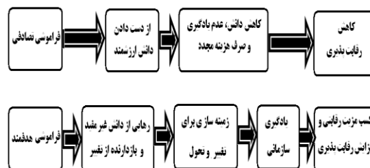
شکل ۱. تأثیرهای انواع فراموشی سازمانی (مشبکی و ربیعه، ۱۳۸۸).

در اهمیت فراموشی هدفمند، حاجی عزیزی و همکاران (۱۳۸۸) در پژوهشی تحت عنوان فراموشی سازمانی: رویکردی نوین در مدیریت دانش، به این نتیجه رسیده‌اند که فراموشی هدفمند می‌تواند به معنای کنار گذاردن منابع و رویه‌های منسوخ و همگامی با پیشرفت‌های حاصل در جهت ارائه محصولات و خدمات سودمند اطلاعاتی باشد (۴). پاک‌نژاد و همکاران (۱۳۹۰) در تحقیقی با عنوان رابطه میان سازمان‌های یادگیرنده و آمادگی در برابر تغییر در سازمان تربیت‌بدنی، به این نتیجه رسیدند که ادراک کارکنان از سازمان خود به عنوان یک سازمان یادگیرنده و آمادگی در برابر تغییر در حد متوسط قرار دارد و رابطه مثبت و معناداری بین ابعاد سازمان‌های یادگیرنده و آمادگی در برابر تغییر در سازمان تربیت‌بدنی به دست آمد (۳). صادقان و همکاران (۱۳۹۱) نیز در مقاله خود تحت عنوان بررسی رابطه فراموشی سازمانی هدفمند و چابکی سازمانی، به بررسی موضوع در بین ۴۳ نفر کارمند سازمان فناوری اطلاعات و ارتباطات (فاوا) شهرداری شیراز پرداخته و نتایج کسب‌شده بیان می‌دارد که فراموشی سازمانی هدفمند پیش‌بینی خوبی را از چابکی سازمانی داشته و در بین